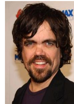
Peter Dinklage (ator) Emmy Award e Golden Award