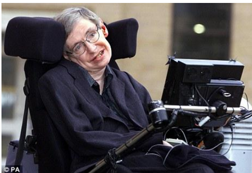
Stephen Hawking (físico) Doutor e Professor Emérito de Cambridge