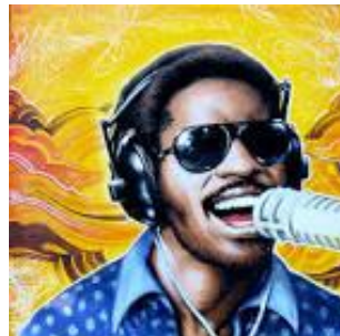
Stevie Wonder (cantor) 25 Grammy Awards